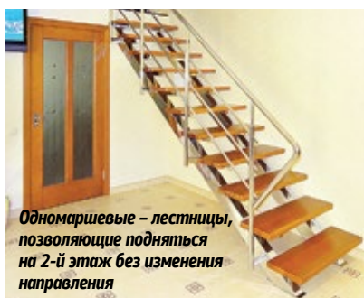
Одномаршевые – лестницы, позволяющие подняться на 2-й этаж без изменения направления